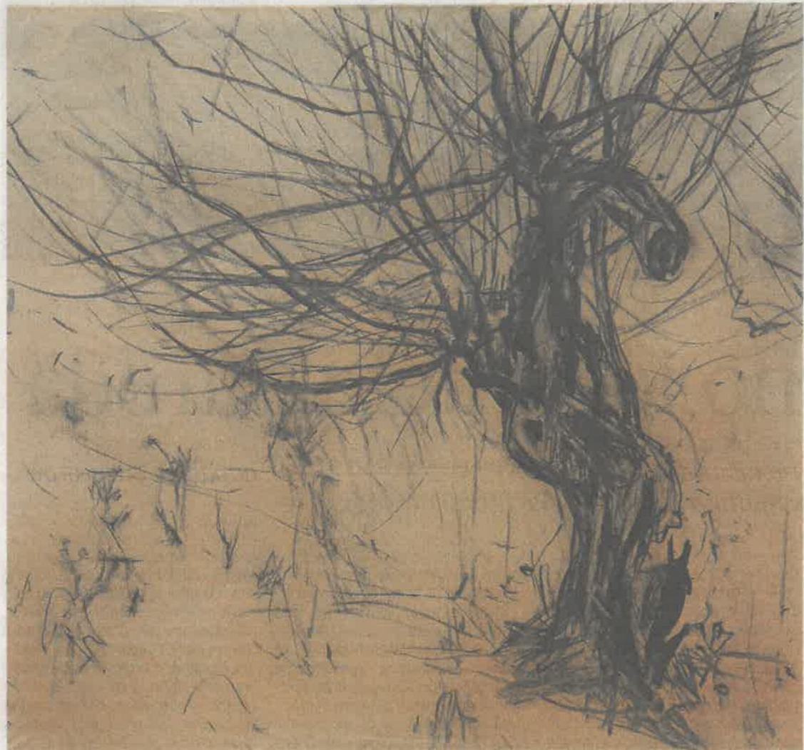
Stojan Grauf: Brez naslova , oglje na platnu

Danes je veliko gromoglasnega agitiranja o pomenu narave, morda bi bilo bolj učinkovito, če bi se z njo poistovetili na osebnih in intimnih ravni?