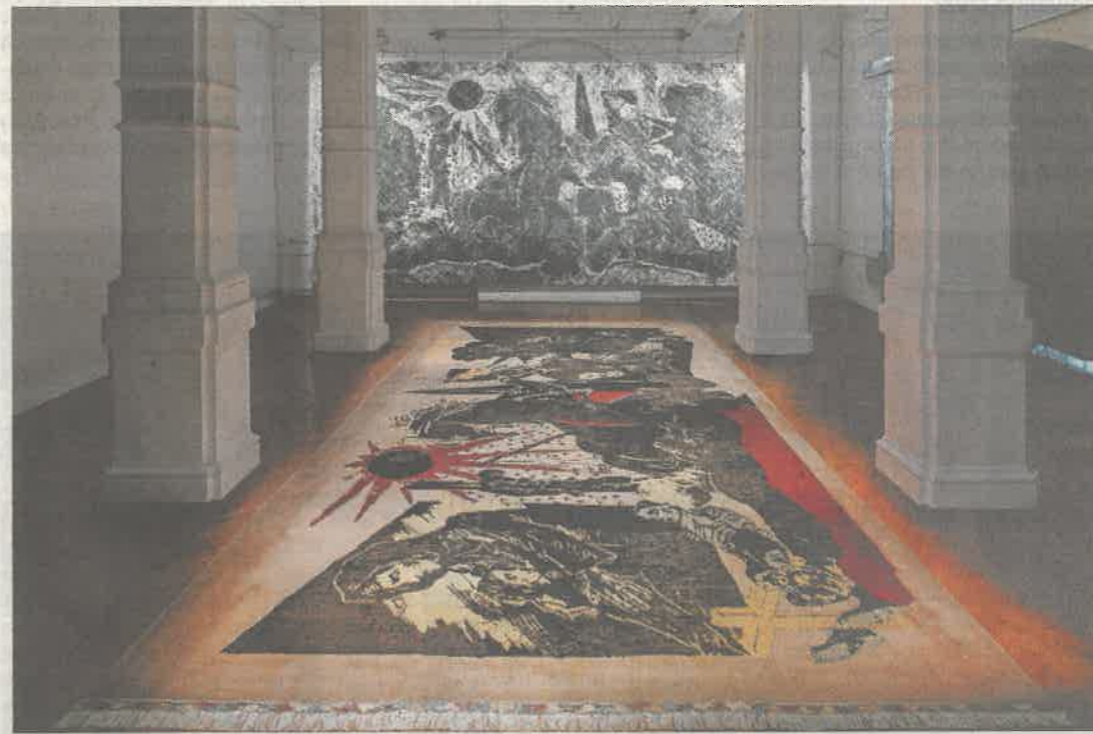
Pri Laibachu se seveda niso odrekli svoji megalomaniji, preproga je označena kar za slovensko Guernico.