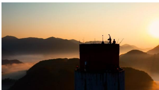
Vrtoglavi ptič 2020, VR doživetje (v sodelovanju z Dunkin Devils, HSE, Arctur in Iztokom Kovačem), 2020. Foto: zajem zaslona.

»Naložbo sofinancirata Republika Slovenija in Evropska unija iz Evropskega sklada za regionalni razvoj.«