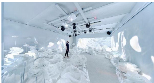
KIBLA2LAB in Arboretum Volčji Potok, VRTN!CA, pilotni projekt, 2021, fotografija postavitve razstave.