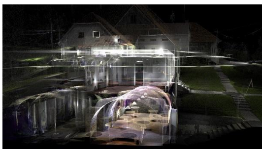
KIBLA2LAB in Fakulteta za kmetijstvo in biosistemske vede UM. Nevidni Maribor: Nadvojvoda Janez, oče Meranovega, pilotni projekt, 2022, 3D laserski sken posestva Meranovo, zajem zaslona.