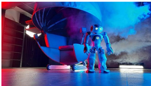
NeuroFly (pilotni projekt v sodelovanju z AFormX) in robotka EVA.