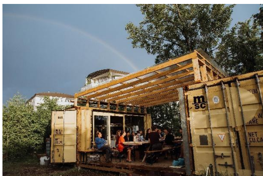
Društvo Trajna, Laboratorij KRATER, pilotni projekt.