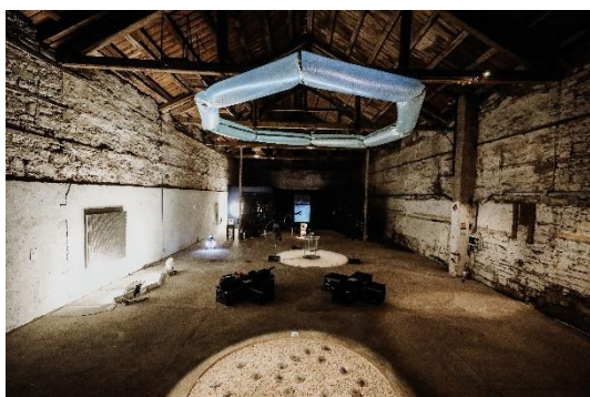
IZIS 2200 UND3R, festival sodobne intermedijske umetnosti, 2021.